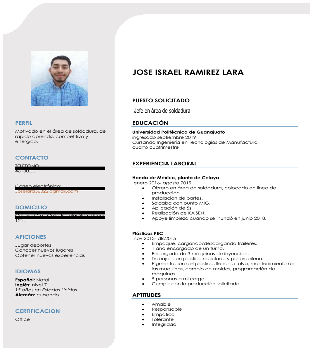
Figura 2. Ejemplo de Currículum vitae cronológico.