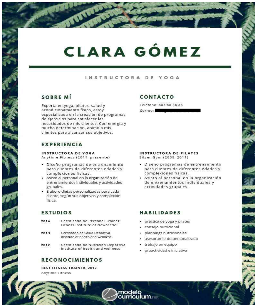
Figura 4. Ejemplo de Currículum vitae mixto.