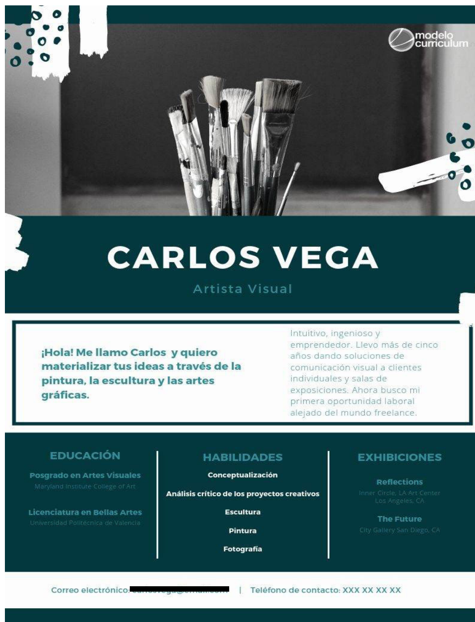
Figura 3. Ejemplo de Currículum vitae funcional.